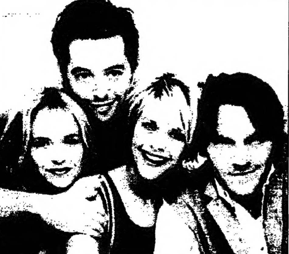
في اليسار إلى اليمين: كيلي بريستون في دور «مدينا» وماتيو برونديك في دور «سام» وميغ ريان في دور «مغربي» وشيفي كايرو في دور «الفتون» في فيلم «مدمنة على الحب».

أسباب قد تحتاج إلى بحث وشرح من علماء الاجتماع كانت الأفلام الرومانسية الكوميدية تارة تسمى خلال التسعينات. أما في الأفلام هذا النوع التي تتكلمها غير الفيلمي "Sleepless in Seattle" و"When Harry met Sally" و"كارتول لومبارد وأيرين دون آخر زمان. ومرة أخرى تبرز ميغ ريان وماتيو برونديك في دور «مدينا» و«سام» في فيلم «مدمنة على الحب» الذي قد يكون العلاج للرباط المستساغ جدا ضد زحمة أفلام الوحوش والكوارث التي ستعرض في موسم السينما الصيفي. وللاستمتاع بهذا الفيلم ينبغي عليك أن تتقلب على عنصر الإثارة في الصورة. وقد لا يكون ذلك سهلا لبعض المشاهدين. ماتيو برونديك يوزن في دور عالم لك بارز غارق حتى أنثيه في موهي كيلي بريستون للعبة في مدرسة البلدية الصغيرة. وهي تتكلم في نيويورك في مهمة تعليمية. ومن هناك تبحث إليه برسالة تعلمه فيها أنها قررت الانفصال عنه. أنه يرفض تخليها عنه ويعتبرها إلى انتها ريان للصورة التي تركب الدراجة النارية وهي تسمى إلى الانتقام من الفرنسي الذي تخلى عنها وأي انتقام. وهذا يعطى برونديك وريان لأمره مقدرة ومهارة لتدريب كايرو. ويقول برونديك: «مدمنة على الحب» سيصبح لحظة براءة على الأرض. ويقول برونديك في مقابلة مع مجلة «الواشيتون» ويخبر عن تفاصيل اللقائ المضحكة والسادية أحيانا ضد كايرو للسكن الذي يتبين في النهاية